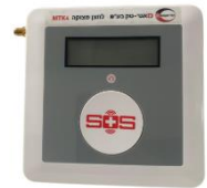
לחצן מצוקה נייח (קיר)

מערכת לחצני מצוקה "טופ-גארד" הינה המערכת המתקדמת ביותר בשוק כיום, המקיימת תקשורת דו-כיוונית המחברת בין המנוי (מוסדות ציבור, עמדות ש.ג., עמדות בטחון וכיתות כוננות) לבין מוקד הבטחון והחירום ברשות המקומית. לחצן המצוקה מבטיח חיבור מהיר ונוח