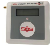
לחצן מצוקה נייד (קיר)

לחצן המצוקה מבטיח חיבור מהיר ונוח למוקד החירום והסיוע של הרשות המקומית. קיומו של לחצן המצוקה מקנה תחושת ביטחון לעובדי הרווחה והעו"ס, במסגרת העבודה ובזמן שיגרה, חירום וגם במצבי מצוקה שונים, בהם אין יכולת לדבר / לתקשר.