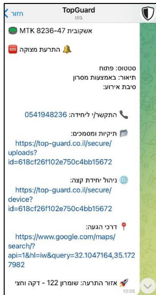
התראה קופצת באפליקציית טלגרם